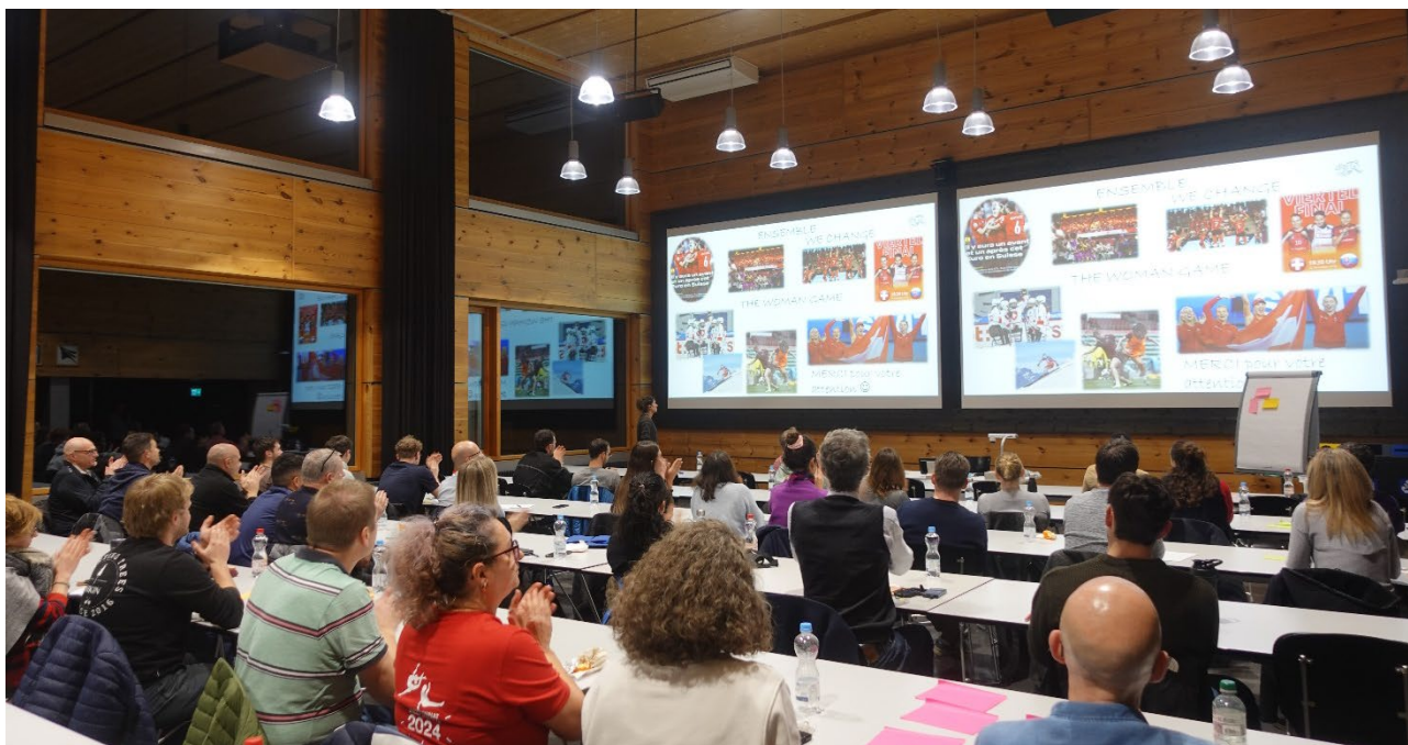
Abbildung 5: Einblick in den Workshop «Femmes et sport : Prévention des blessures chez les athlètes féminines»