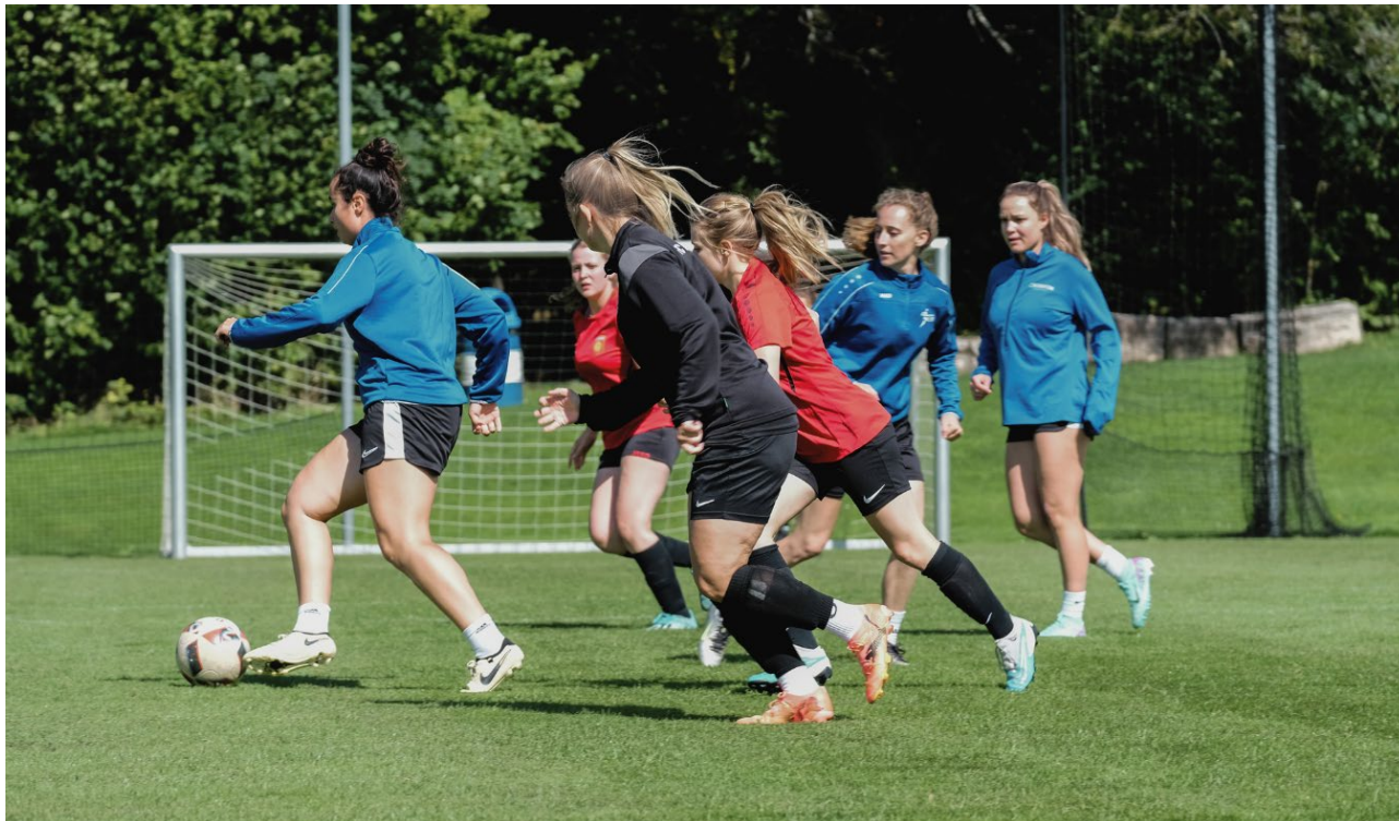
Abbildung 4: Teilnehmerinnen des Trainerinnenkurses 2025 in Aktion

In der Region Bern/Jura waren Anfang 2024 rund 300 Fussballtrainerinnen tätig. Dies entspricht einem Frauenanteil von etwa 8 Prozent aller Fussballtrainerinnen und -trainer ( Fussballverband Bern/Jura - Trainerinnen ). Zur gezielten Förderung von Frauen in Trainerinnenfunktionen wurde in Zusammenarbeit mit dem regionalen Fussballverband Bern/Jura (FVBJ) eine J+S-Grundausbildung exklusiv für Frauen durchgeführt. Dank der Trainerinnenkurse, die in den Jahren 2024 und 2025 stattfanden, konnten über 60 neue Trainerinnen ausgebildet werden. Das Angebot stiess bei den Teilnehmerinnen und bei den Fussballvereinen auf durchweg positive Resonanz.