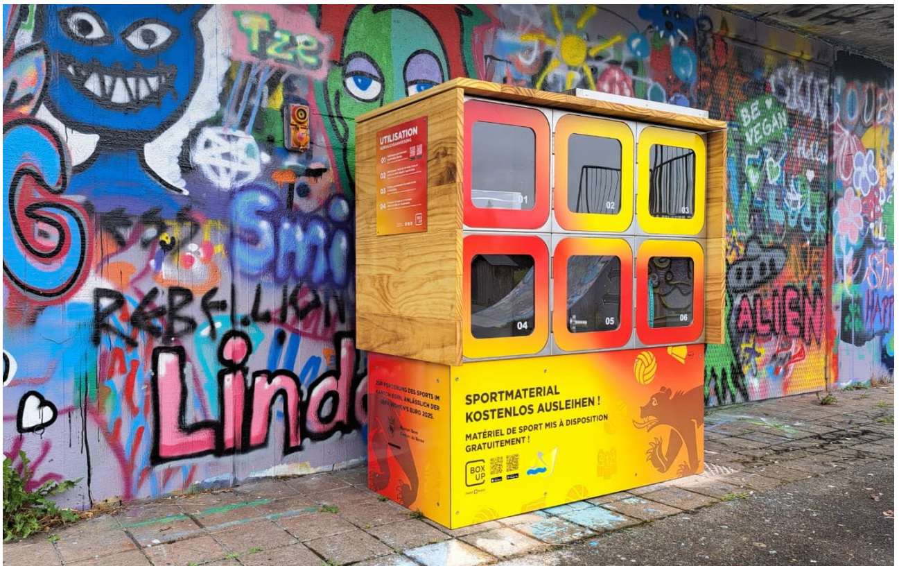
Abbildung 3: Ausleihstation in Moosseedorf

Im Rahmen des Teilprojekts «Frei zugängliche Ausleihstationen für Sportmaterial» wurden an 13 Standorten im Kanton Bern neue BoxUp-Stationen installiert. BoxUp-Stationen sind frei zugänglichen Ausleihstationen, die es der Bevölkerung ermöglichen, Sport- und Spielmaterial kostenlos und unkompliziert per App auszuleihen. Sportgeräte müssen so weder selbst gekauft noch zum Sportplatz mitgebracht werden, sondern stehen direkt vor Ort zur Verfügung. Der niederschwellige Zugang senkt Hürden zur sportlichen Betätigung und ist insbesondere für die Förderung der sportlichen Aktivität von Mädchen von Bedeutung. Die BoxUp-Stationen leisten daher einen konkreten Beitrag zur Umsetzung der Sportstrategie des Kantons Bern einerseits, zur Förderung der sportlichen Aktivität von Mädchen andererseits.