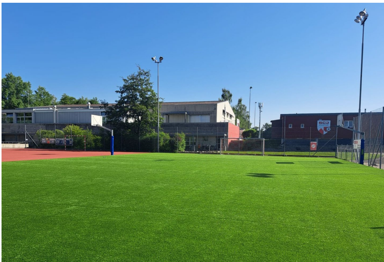
Abbildung 2: Mobiles Kunstrasenfeld in Jegenstorf

Der Schweizerische Fussballverband erwartet infolge der WEURO25 bis 2027 eine Verdoppelung der Anzahl fussballspielender Mädchen und Frauen (vgl. Fussballverband Bern/Jura - Spielerinnen ). Um den damit verbundenen infrastrukturellen Engpässen im Kanton Bern entgegenzuwirken, beschaffte das Kompetenzzentrum Sport zwölf mobile Kunstrasenfelder. Diese wurden im Rahmen eines Bewerbungsverfahrens kostenlos ins Eigentum von Berner Gemeinden übergeben und ermöglichen es, bestehende Flächen wie Hartbelag- oder Tartanplätze ohne bauliche Anpassungen witterungsunabhängig für Trainings und sportliche Aktivitäten zu nutzen. Insbesondere in den Wintermonaten erweitern sie die Trainingskapazitäten, unterstützen dabei, die erwartete Zunahme des Fussball-Engagements von Mädchen und Frauen durch die WEURO25 aufzufangen, und leisten so einen direkten Beitrag zur nachhaltigen Sportförderung.