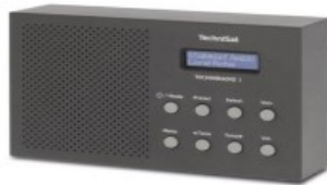
Batteriebetriebenes Radio (UKW, DAB+)